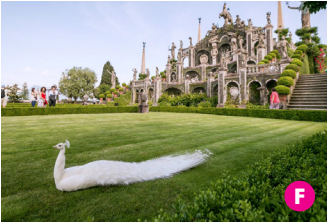
▲ L'Isola Bella con il suo giardino all'italiana. Isola Bella with its italian garden.