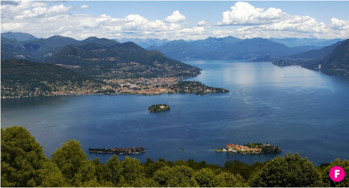
◀ Le Isole Borromee. Borromean Islands.