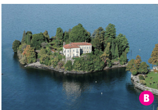
◀ L'Isolino di San Giovanni, davanti a Pallanza, in cui soggiornò a lungo il direttore d'orchestra Arturo Toscanini.

Villa Taranto, view of Fontana dei Putti and majestic lotus flowers.