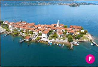
▲ La pittoresca Isola dei Pescatori. Picturesque Isola dei Pescatori.