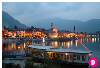
▲ Feriolo, il suo lungalago è uno dei più caratteristici del Lago Maggiore.

Fondotoce Nature Reserve with reeds luxuriant vegetation.