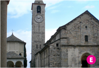
▲ Baveno, la Chiesa Romanica risalente al XII secolo. Baveno, Romanesque church from XII century.