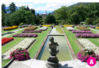
▲ Villa Taranto, vista della Fontana dei Putti e i maestosi fiori di loto.

Villa Taranto, view of Fontana dei Putti and majestic lotus flowers.