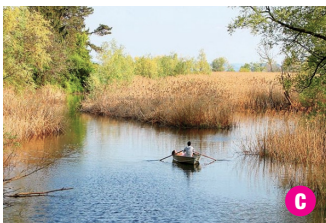
▲ La Riserva Naturale di Fondotoce con la lussureggiante vegetazione dei canneti.

Fondotoce Nature Reserve with reeds luxuriant vegetation.